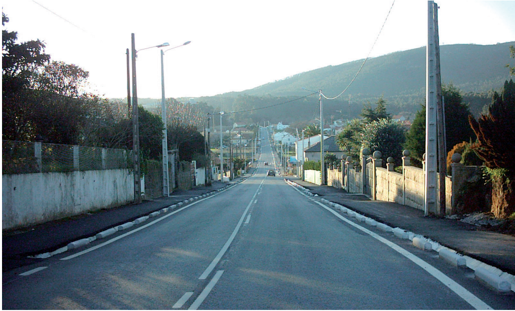
Novos accesos viarios de estradas: Polígono Industrial de A Tomada, Hospital da Barbanza, estrada Virxen do Monte-Aldea Vella, Ctra de Mirandela.