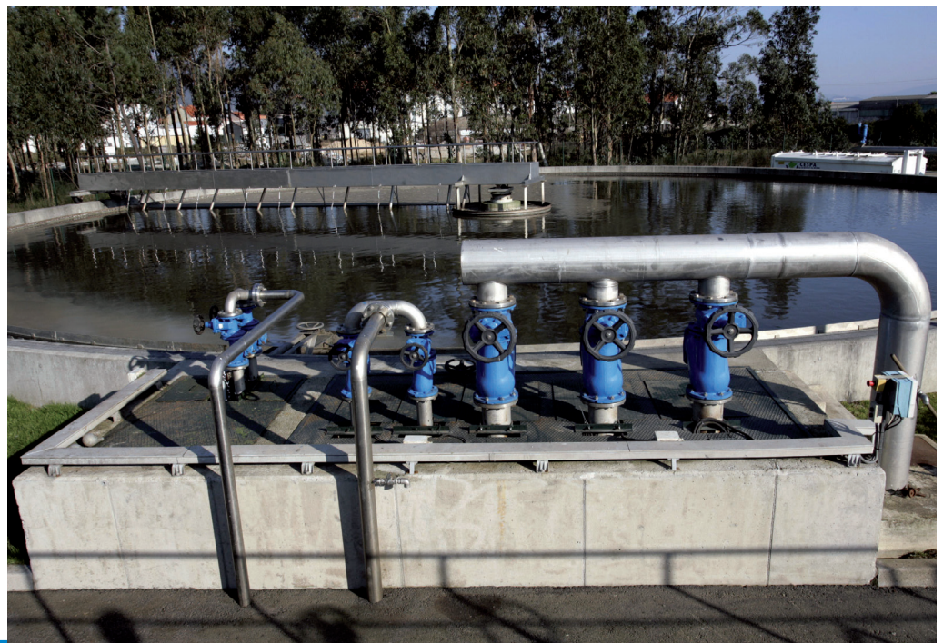
Estamos moi preto de acadar o saneamento integral do noso Concello, cun 92 % do mesmo realizado.