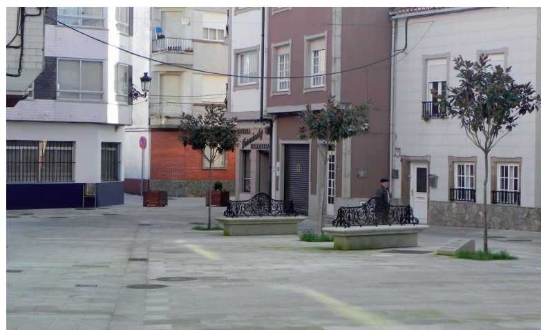
Remodelación e conservación de prazas e a súa conversión en peonís para o disfrute de todos e potenciación do Comercio Local.