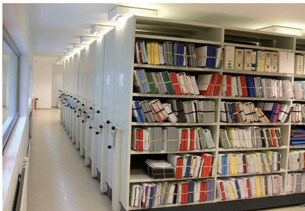
Ampliación Arquivo Municipal.