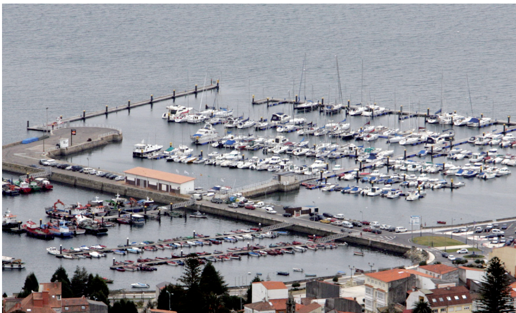
Ampliación e construción de novos pantaláns para os sectores náutico, mexilloeiro e pesqueiro, así como ampliación do peirao comercial.