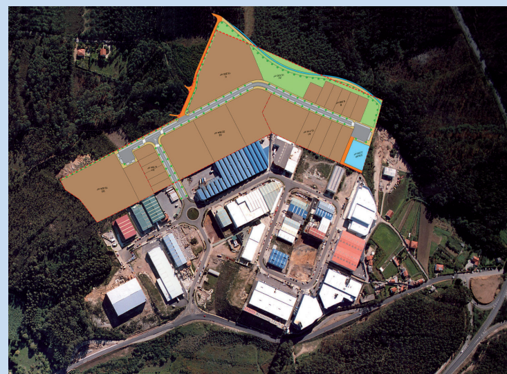
Ampliación do Polígono Industrial de A Tomada en 100.000 m 2 , así como novas conexións viarias de comunicación coa Autovía do Barbanza.