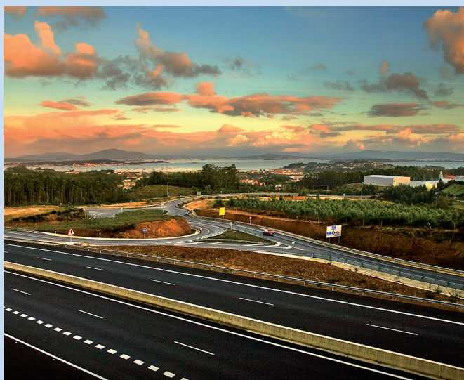
Nova vía de acceso ao Polígono Industrial de A Tomada e ao Hospital do Barbanza