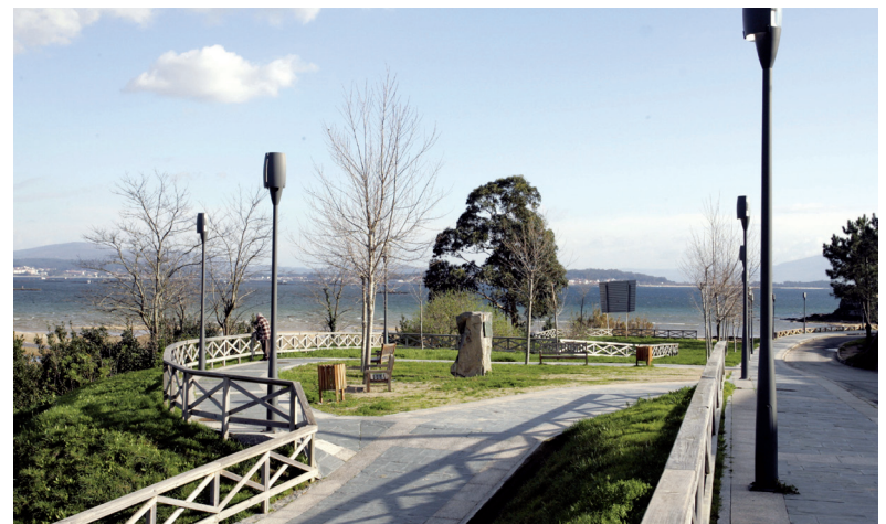
Remodelación, mellora e construción de Espazos naturais como: Xardíns Valle-Inclán, construción de novos paseos marítimos, sendas peonís e áreas de ocio para os máis cativos e os maiores.